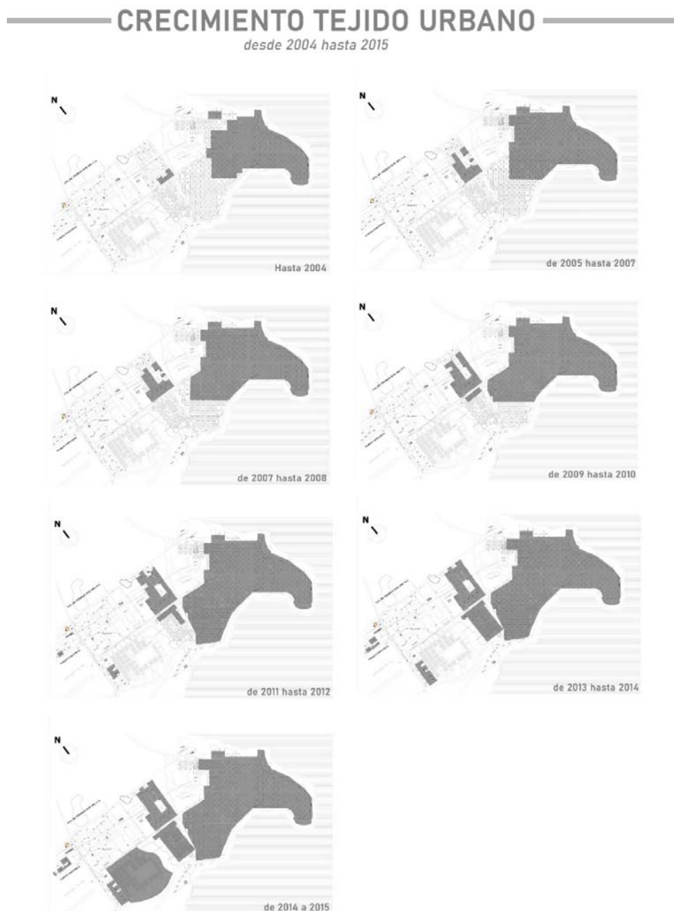
Figura 3.: Crecimiento del tejido urbano de Puerto San Julián, 2004-2015

Fuente: Dirección de Obras Públicas, Municipalidad de Puerto San Julián. 2021.