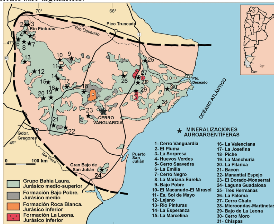
Mapa 2.: Unidades estratigráficas jurídicas del Macizo del Deseado con distribución de las principales mineralizaciones auro-argentíferas.

El Macizo del Deseado (Cf figura 2) es una provincia geológica que abarca un área de unos 60.000 Km 2 (Guido y González Guillot, 2004) localizado en el centro-norte de la provincia de Santa Cruz (entre los ríos Deseado al norte y Chico, al sur) y recibe gran valorización por sus características geológicas, rica en minerales y metales preciosos (Ministerio de Hacienda, 2018). Políticamente el área del Macizo involucra partes de los Departamentos Lago Bs. As., Deseado, Magallanes y Río Chico y es la misma área en la cual se asentó y prosperó la ganadería ovina extensiva durante más de 100 años, encontrándose todavía hoy un importante número de establecimientos que pugnan por continuar produciendo a la sombra de la gran minería.